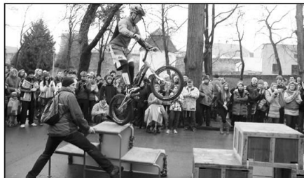
Otec a syn Hlávkovi.